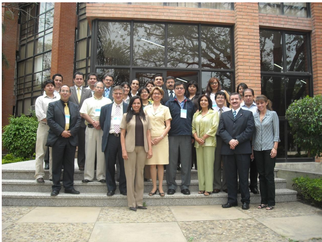
Asistentes al Primer Seminario en Santa Cruz, 26 y 27 de octubre del 2009

En la primera parte se presentará una relación de los resultados logrados en los dos seminarios de formación en Dirección Estratégica realizados en el país, y en la segunda se presentará la planificación definida para el Observatorio Boliviano en los años 2011 y 2012.