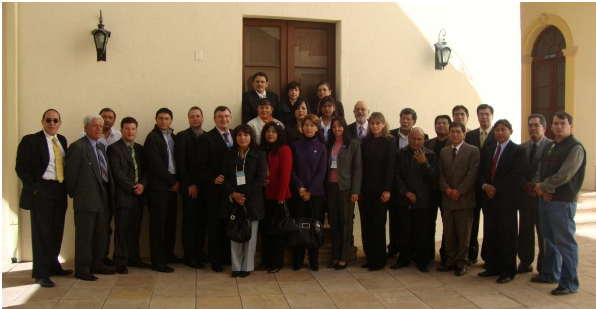
Asistentes al Seminario en Sucre el 14 y 15 de junio 2010

El programa de ambos seminarios estaba conformado en tres partes, la primera correspondía a la presentación del Programa Alfa III así como el Proyecto Telescopi, esto con la finalidad que todos los participantes conozcan el programa y sus alcances. En la segunda parte se abordó el marco conceptual de la Dirección Estratégica al cual se adscribe el proyecto y la presentación de los resultados del estudio del estado de la dirección estratégica en las universidades de Bolivia. La tercera parte tuvo sus variantes importantes en ambos seminarios, en el primero se presentó el sistema de indicadores y evaluación de gestión universitaria; en el segundo el Despliegue y lineamiento del Plan Estratégico y el Cuadro de Mando Integral aplicado a la Gestión Universitaria.